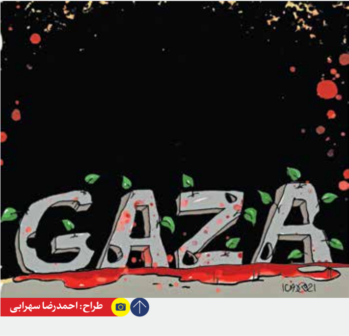
طراح: احمدرضا سهرابی