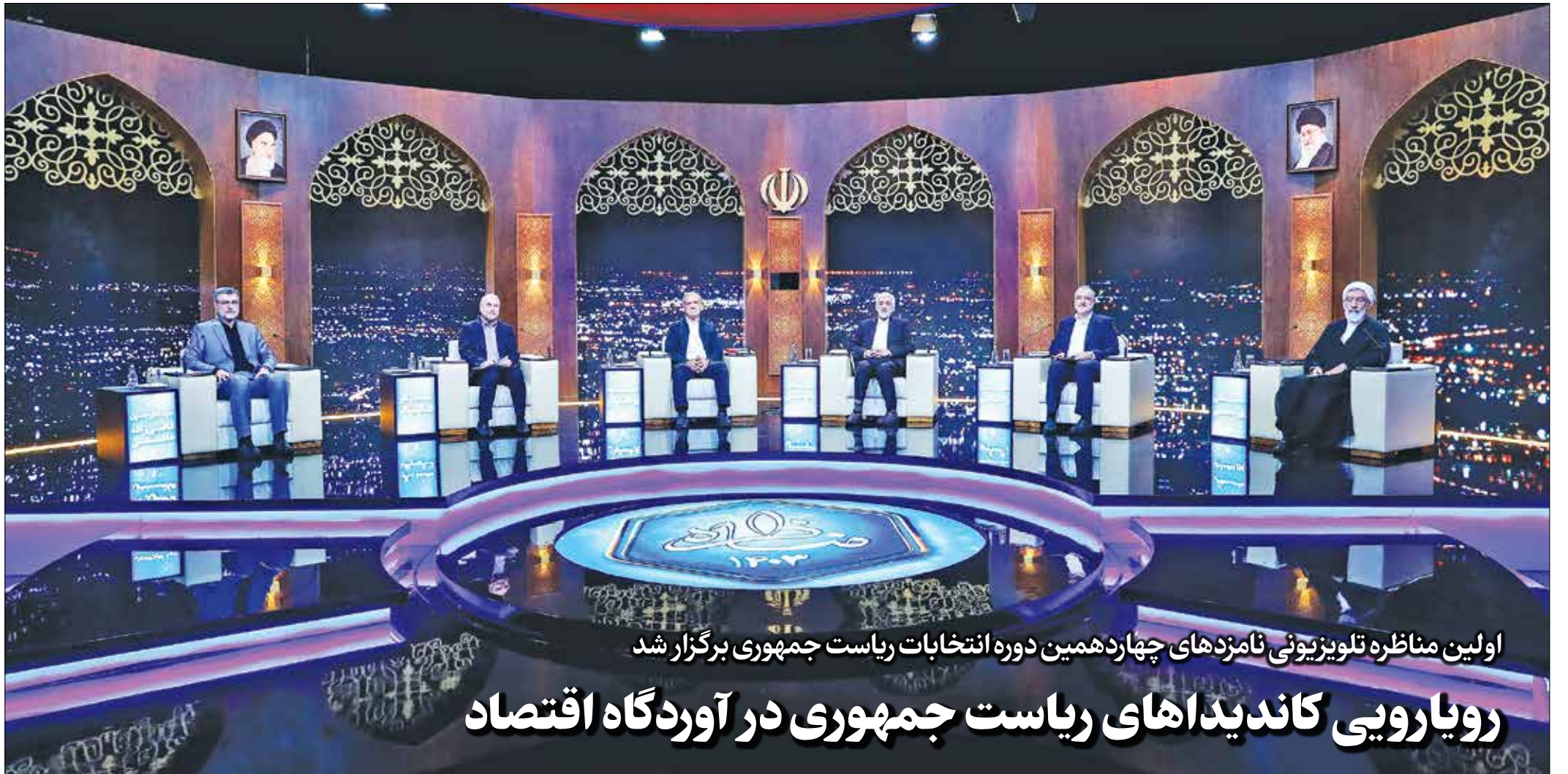
اولین مناظره تلویزیونی نامزدهای چهاردهمین دوره انتخابات ریاست جمهوری برگزار شد

رویکرد تحولگرا در دولت سیزدهم منجر به احیای روابط دولت با جریان های سیاسی موافق و منتقد و نیز احیای روابط دولت و قوای دیگر شد