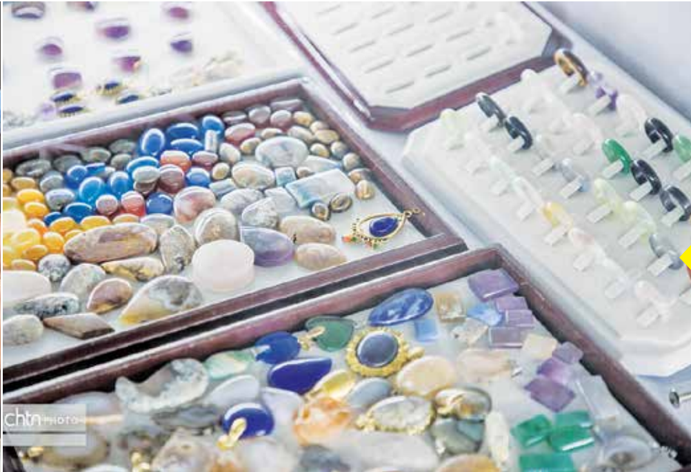
خراسان جنوبی با وجود کویری بودن سرشار از سنگ‌های قیمتی و نیمه قیمتی است و گوهر تراشی میراثی ماندگار در دل کویرشده است. تنوع سنگ‌های قیمتی در خراسان جنوبی آتقدر زیاد است که آن را تبدیل به سرزمین سنگ‌های قیمتی کرده است.