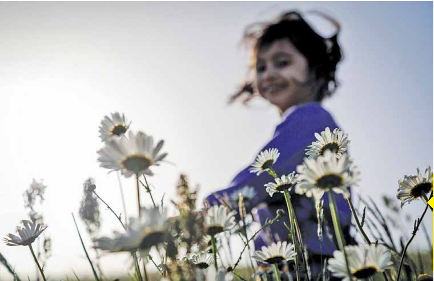
جنگل فندقلو با انبوه درختان سبز در مسیر جاده حیران به سمت اردبیل قرار دارد. رویش گل‌های بابونه در اواخر فصل بهار زمینه حضور گردشگران زیادی را در این منطقه فراهم می‌کند.