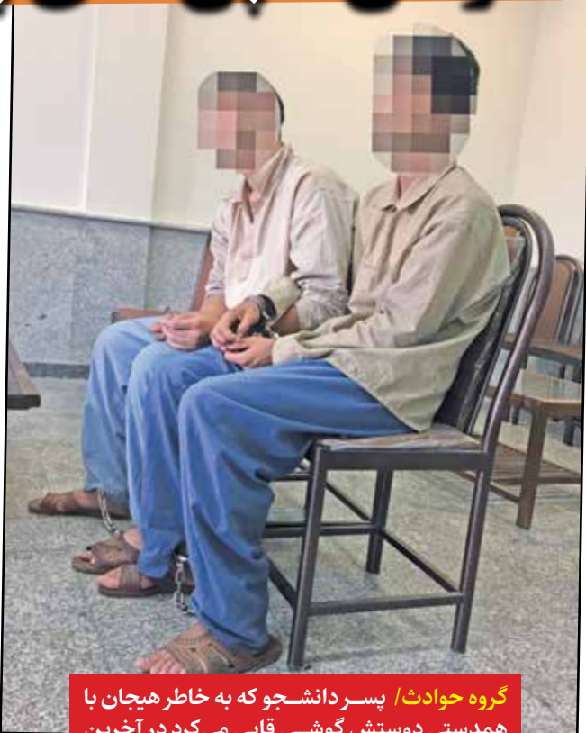
گروه حوادث/ پسر دانشجو که به خاطر هیجان با همدستی دوستش گوشی قاپی می کرد در آخرین سرقت خود تلفن همراه یک والیبالیست مطرح را سرقت کرد.

آتش سوزی گسترده و سنگین در فروشگاه و انبار لوله و اتصالات واقع در طبقه همکف یک مجتمع مسکونی تجاری ۷ طبقه در شیراز مهار شد. هادی عیدی پور رئیس سازمان آتش نشانی و خدمات ایمنی شهرداری شیراز گفت: این حادثه ساعت ۲۰ سه‌شنبه، ۲۲ خردادماه رخ داد و به علت سنگین بودن آتش سوزی ۱۰ ایستگاه آتش نشانی در محل حاضر شدند. این حادثه در فروشگاهی به مساحت ۳۰۰ متر مربع در طبقه همکف مجتمع ۷ طبقه با ۸۰ واحد مسکونی در ۲ بلوک مجزا رخ داد. شعله و دود ناشی از حریق در طبقه همکف با کاربری انبار و فروشگاه لوله و اتصالات به طبقات فوقانی سرایت کرده بود که تیم عملیاتی در محل حاضر شده و نسبت به خروج ساکنین در طبقات و نجات افراد اقدام کرده و همزمان از سرایت حریق به طبقات فوقانی و فروشگاه پوشاک مجاور جلوگیری و نسبت به اطفای حریق اقدام کردند. این حادثه تلفات جانی نداشت و علت حادثه در دست بررسی است.