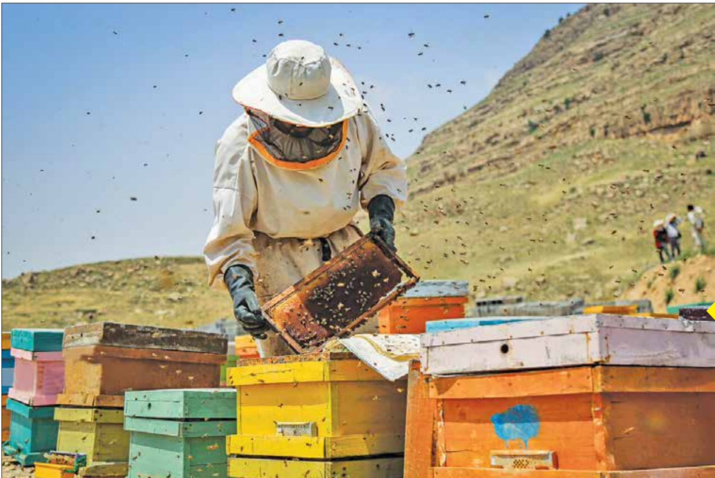
کیفیت عسل طبیعی ایران در جهان زبانزد است. این مساله ناشی از اقلیم خاص و شرایط طبیعی ویژه کشورمان است اما امروز پرورش زنبور در ایران شرایط مناسبی ندارد. این در حالی است که پرورش زنبور در صورت رعایت اصول علمی، پیشه‌ای بسیار سودآور است.