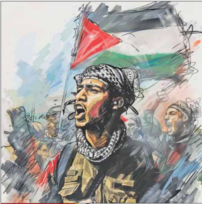
طراح: awni eshtaive