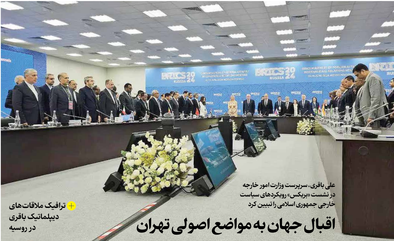
ترافیک ملاقات‌های دیپلماتیک باقری در روسیه

علی باقری، سرپرست وزارت امور خارجه در نشست «بریکس» رویکردهای سیاست خارجی جمهوری اسلامی را تبیین کرد