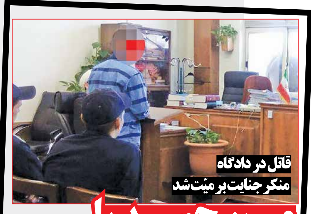
قاتل در دادگاه منکر جنایت بر میت شد