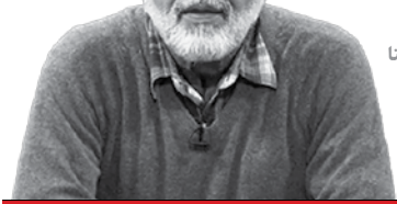
بخشی از صحبت‌های بهروز افخمی با ایسنا

«صبح اعدام» را که بخش آن برعهده حوزه هنری است، احتمالاً تأیید استان اکران می‌کنم. روی چند سناریو کار می‌کنم. یکی از سناریوها «سیاحت شرق» بر مبنای زندگی آقاجفی قوجانی است؛ روحانی دوران مشروطیت که داستان‌نویس خوبی هم بوده و زندگینامه خود را در داستانی که با مرگش شروع می‌شود، نوشته است. این اثر به نمایشنامه رادیویی هم تبدیل شده و مدت‌ها بود می‌خواستیم روی این داستان و شخصیت کار کنیم. در همین زمینه در شبکه سیمرخ اظهار تمایل کردند و قرار است سناریو را برای آن‌ها بنویسم. داستان این فیلمنامه در دوران مشروطیت یعنی زمان ناصرالدین‌شاه تا انقلاب مشروطه اتفاق می‌افتد. درباره زمانی که قرار بود براساس ماجرای قتل داریوش مهرجویی و همسرش بنویسم باید بگویم آنقدر گرفتار حوادث جدید شدم که کار جدیدی در این باره نکرده‌ام و به نظرم باید کسی پیدا شود که این زمان را بنویسد. کم کم دارم به این فکر می‌کنم به دیگران پیشنهاد دهم تا ببینم چه کسی می‌تواند آن را بنویسد و خودم هم کمکی به او بکنم.