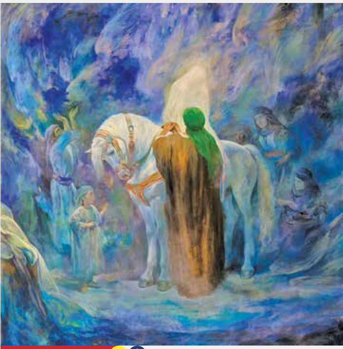
نقاش: حسن روح الامین

جدیدترین تابلوی نقاشی حسن روح الامین، نقاش و تصویرساز با عنوان «سرخ البحرین» به معنی تلافی دودربیا با موضوع ازدواج حضرت علی (ع) و حضرت زهرا (س) رونمایی شد.