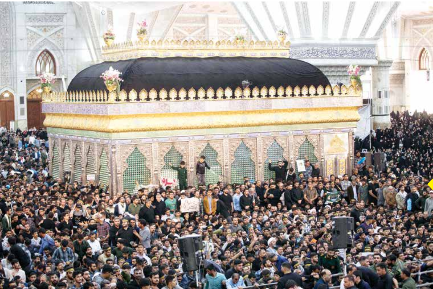
سی و پنجمین سالگرد ارتحال امام خمینی (ع) مراسم سی و پنجمین سالگرد ارتحال امام خمینی (ع) با حضور افشار مختلف مردم در حرم مطهر برگزار شد.