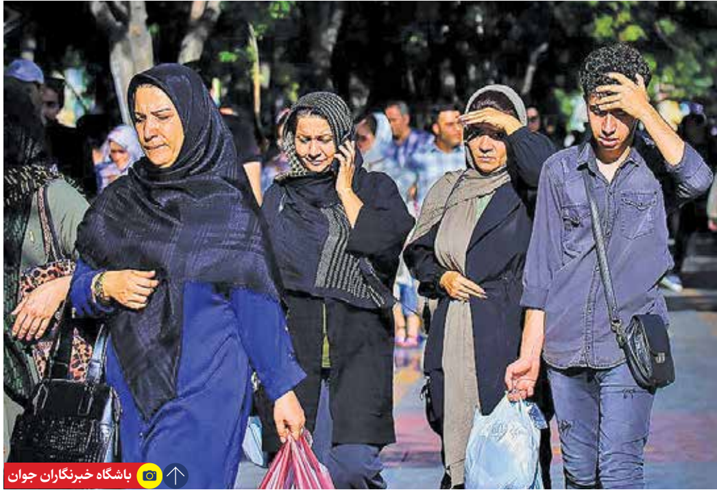
باشگاه خبرنگاران جوان

دمای هوا در هفته آینده به ۴۸ درجه هم می‌رسد