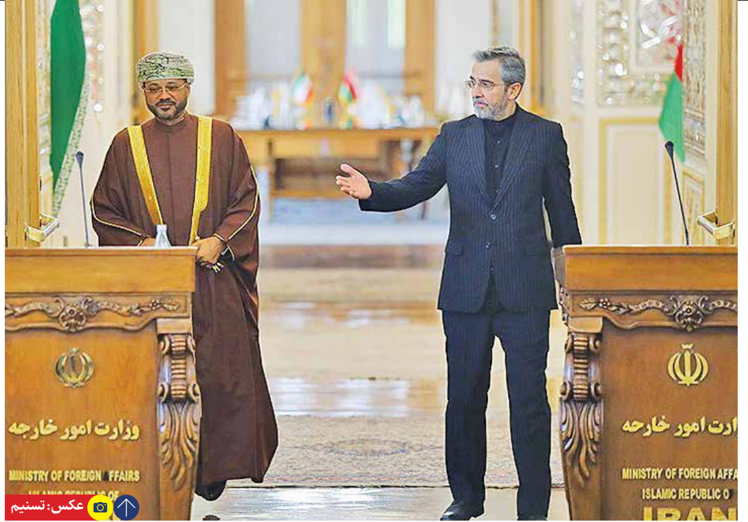
همزمان با سفر وزیر خارجه عمان به ایران مطرح شد