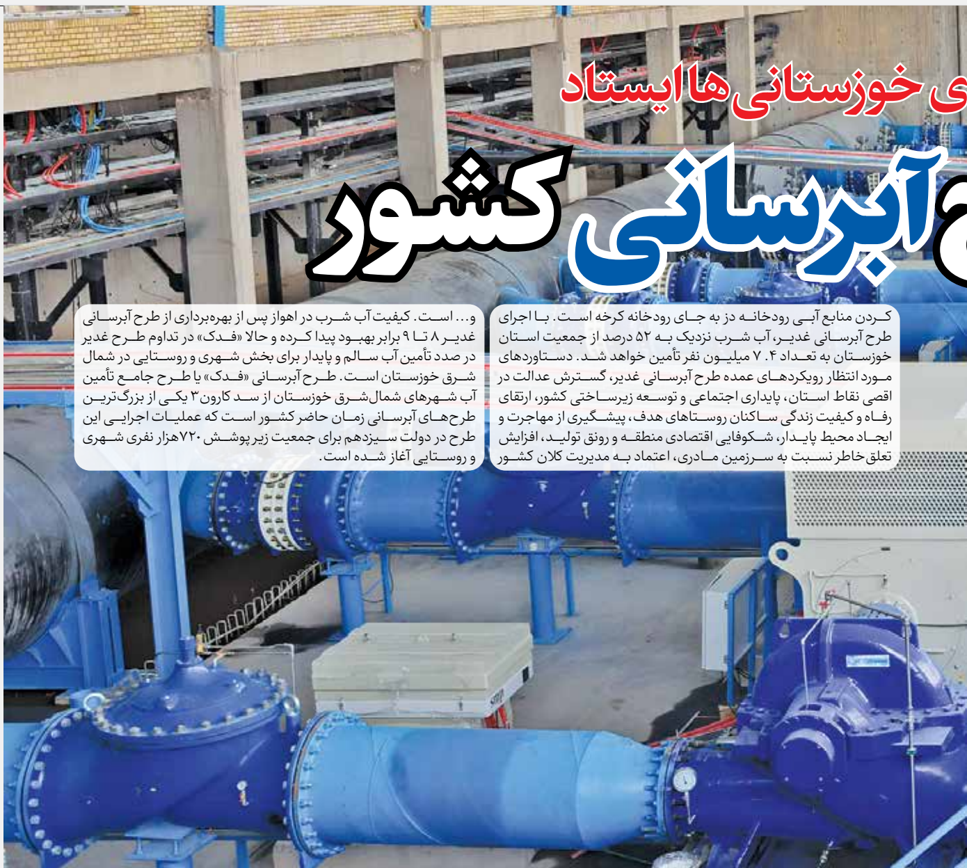
افتتاح طرح بزرگ آبرسانی غدیر خوزستان

و... است. کیفیت آب شرب در اهواز پس از بهره‌برداری از طرح آبرسانی غدیر ۸ تا ۹ برابر بهبود پیدا کرده و حالا «فدک» در تداوم طرح غدیر در صد تأمین آب سالم و پایدار برای بخش شهری و روستایی در شمال شرق خوزستان است. طرح آبرسانی «فدک» با طرح جامع تأمین آب شهرهای شمال شرق خوزستان از سد کارون ۳ یکی از بزرگ‌ترین طرح‌های آبرسانی زمان حاضر کشور است که عملیات اجرایی این طرح در دولت سیزدهم برای جمعیت زیر پوشش ۲۰ هزار نفری شهری و روستایی آغاز شده است.