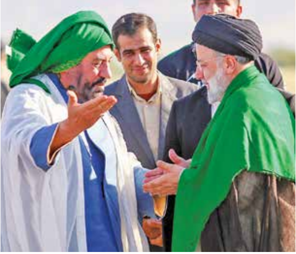
خوزستانی‌ها آن سال‌ها را

یادشان نمی‌رود؛ همان روزهای طاقت‌فرسایی که طرح آبرسانی غدیر، متوقف شده بود؛ توقف اجباری. در طول ۱۰ سال و در دولت‌های مختلف به دلیل کمبود بودجه، لاک‌پستی و تنها با پیشرفت ۳۹ درصدی، توانسته بودند اسم طرح را به عنوان «بزرگ‌ترین طرح آبرسانی خاورمیانه» زنده نگه دارند. اما خوزستان، سرزمین رودهای روان، مثل ماهی بیرون افتاده از دریا، روی خاک جان می‌داد از تشنگی، که با آمدن سید ابراهیم، ورق‌ها برگشت و آب، با وجود تمام مانع‌تراشی‌ها، به شریان ۲۶ شهر و هزار روستای تپ‌دار خوزستان رسید و طرح غدیر، اجرا شد.