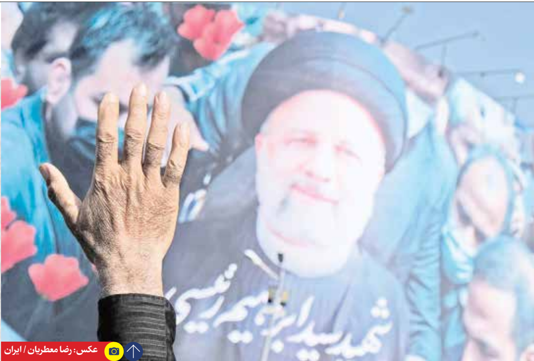
عکس: رضا معطریان / ایران