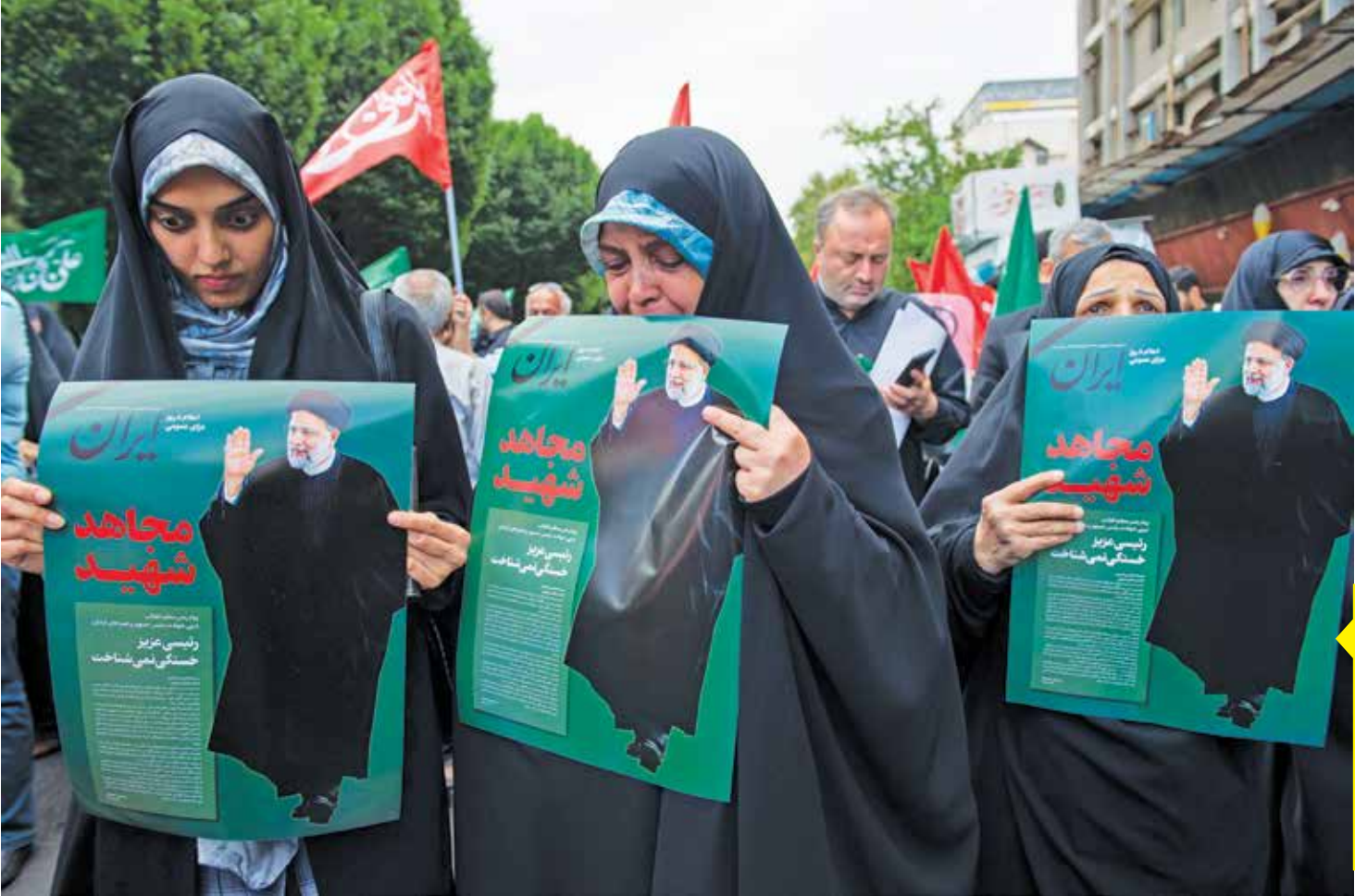
مردم ایران در سراسر کشور، در سوگ شهادت رئیس‌جمهوری محبوب خود به عزاداری پرداخته و دعای خیر، بدرقه سفر ابدی‌اش کردند.

رئیس‌کمیسیون فرهنگی مجلس شورای اسلامی در پیامی درباره شهادت حجت‌الاسلام رئیسی گفت: گرچه رفتن ایشان دل‌دلدادگان را سخت سوزاند ولی او برای همیشه سید محرومان خواهد بود. مرتضی‌آقانهانی، رئیس‌کمیسیون فرهنگی مجلس شورای اسلامی در پیامی شهادت دکتر رئیسی، رئیس‌جمهور و هیأت همراهش را تسلیت گفت. متن پیام به این شرح است: مِنَ الْمُؤْمِنِينَ رِجَالٌ صَدَقُوا مَا عَاهَدُوا اللَّهَ عَلَيْهِ فَمِنْهُمْ مَن قَتَلَ نَفْسَهُ وَمِنْهُمْ مَن يَنْتَظِرُ وَمَا بَدَّلُوا تَبْدِيلًا برادرم حضرت حجت‌الاسلام سید ابراهیم رئیسی اعلی‌الله مقامه از برترین عزیزانی بود که سال‌ها توفیق خدمتگزاری به آستان مبارک حضرت علی ابن موسی‌الرضا علیه‌الآل‌التحیه و الشاء را داشت و در آن ساحت افتخار تولیت و خدمت به زائران و محرومان پناهنده به آن درگاه، هم و غم او بود. حال و هوای خدمتگزاران به ساحت قدس آن امام همام بر جان دل آن عزیز چنان نشسته بود که دوران ریاست جمهوری‌اش را تحت‌الشعاع قرار داد. او مردی دین‌مدار، با اخلاص، فسادستیز، مردمی، اهل فکر و بصیرت متخلق به اخلاق‌الله، پرتلاش و با گذشت، ولایت‌مدار، ساده زیست، بی‌هوا، مجاهدی انقلابی، مفارم و خوش برخورد بود. پرکشیدن ایشان را در ایام ولادت حضرت ثامن‌الحجج علیه‌السلام‌الله‌گویای پذیرفته شدن ایشان به آن درگاه می‌دانم. او سوخت تا که رهروی راه آزادگان جهان باشد و تمام مراحل برزخ و منازل قیامت را به سهولت بگذراند: نیل به این مقام را به این برادر عزیز تبریک می‌گویم، گرچه رفتن ایشان دل‌دلدادگان را سخت سوزانید ولی او برای همیشه سید محرومان خواهد بود و خواهد ماند. راه پر رونقش، پرهرو باد.