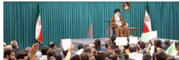
رهبر انقلاب اسلامی ساعاتی پس از سانحه برای آیت الله رئیسی:

پس از انتشار خبر وقوع سانحه برای بالگرد رئیس جمهور و همراهانش، رسانه های مختلف جهان پوشش این رویداد را در صدر اخبار فوری خود قرار دادند. «سی ان ان»، «گاردین»، «بی بی سی» و «فاکس نیوز» از جمله مهمترین رسانه هایی بودند که این خبر را با قید فوریت منتشر و پیگیری کردند.