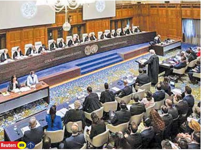
بررسی پرونده شکایت آفریقای جنوبی علیه نسل‌کشی رژیم صهیونیستی در دیوان بین‌المللی دادگستری لاهه

زخم تاریخی آپارتاید را به دوش می‌کشد، برای محکوم کردن اسرائیل در قالب «کنوانسیون ممانعت و مجازات نسل‌کشی ژنو» به طور عملی وارد کارزار حقوقی علیه رژیم شد که هدف حذف سیستماتیک مردم فلسطین از سرزمین‌های اشغالی را جستجو می‌کند. در کنار این تلاش‌ها باید به نقش آفرینی کشورهای مستقل از جمله ایران در کمک به تعیین سرنوشت سیاسی در فلسطین اشغالی و شکل دادن به تلاش‌های جمعی برای فعال کردن سازکارهای بین‌المللی همچون سازمان ملل متحد و دیوان بین‌المللی دادگستری برای محکوم کردن جنایات رژیم صهیونیستی اشاره کرد؛ رویکردی که باید امیدوار بود در بزنگاه مهم این روزهای خونین سرزمین اشغالی، از سوی ایران و دیگر کشورهای دغدغه‌مند به اهداف تعیین شده خود دست یابد و به نایب حق خواهی مردم مظلوم فلسطین لیبیک گوید. در کشاکش این تلاش‌ها ناظران سیاسی و حقوقی، رویکرد ایران را با عینک به قضاوت نهشته‌اند. به اعتقاد شماری از صاحب‌نظران، رویکردی که جمهوری اسلامی در ساحت دیپلماتیک به جریان انداخته