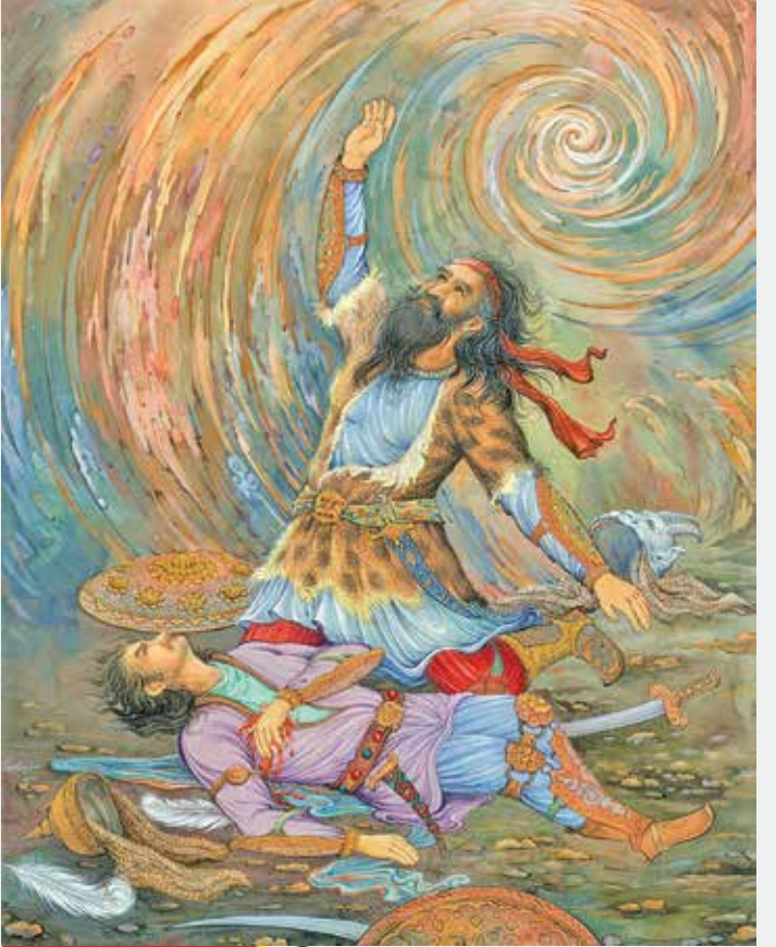
طراح: حسین پدرا لسماء