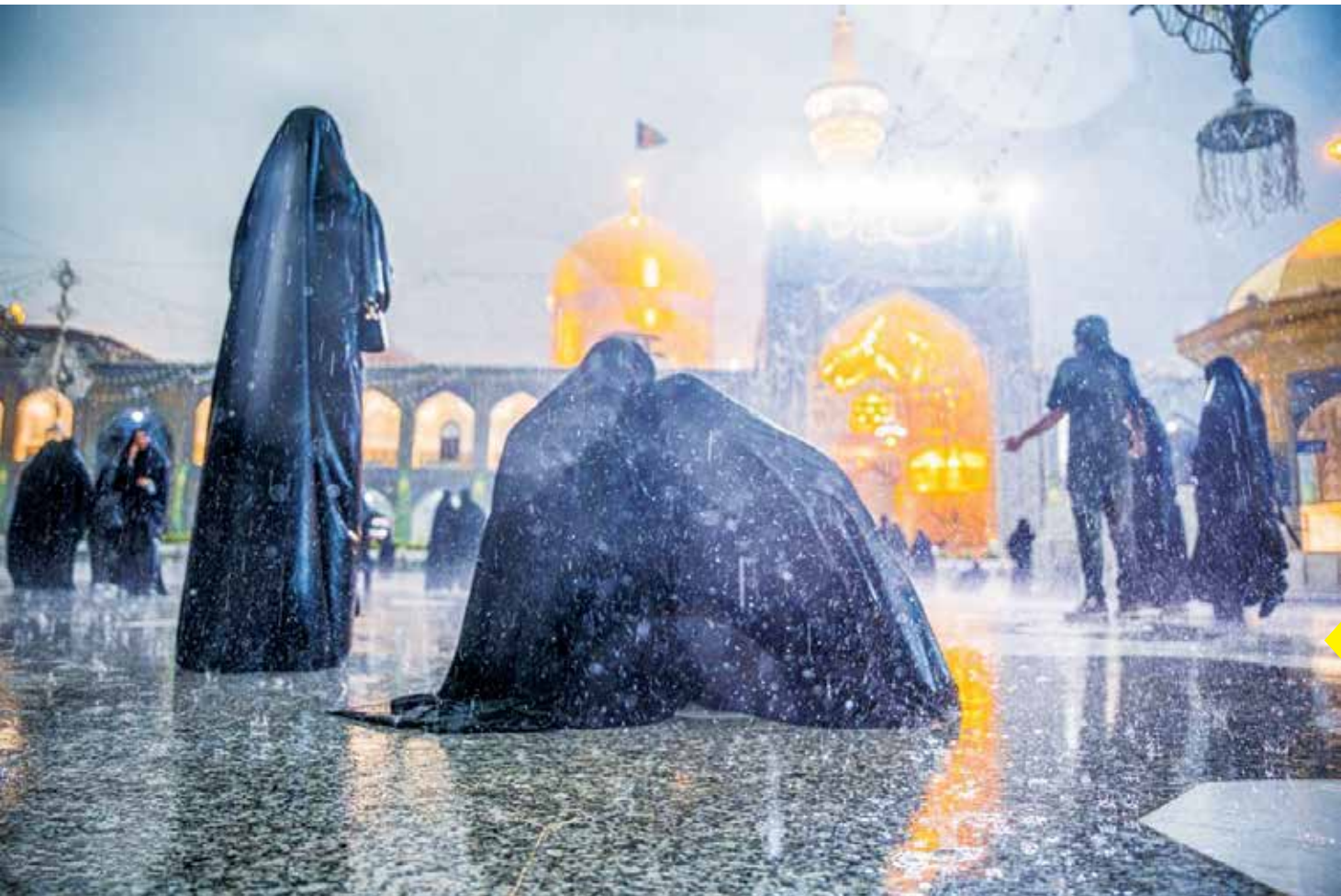
حال و هوای زائران زیر باران شدید دیروز در حرم امام رضا(ع)

در پی بارش شدید باران در مشهد، زائران حرم مطهر امام رضا(ع) در مشهد، زیر سقف الهی ماندند و از نزول رحمت لذت بردند.