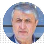
محمد اسلامی رئیس سازمان انرژی اتمی