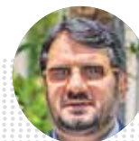
مهرداد بذریاش وزیر راه و شهرسازی