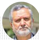
سید صولت مرتضوی وزیر تعاون، کار و رفاه اجتماعی

رویداد هفتگی حیاط دولت که چهارشنبه‌ها پس از نشست هیأت وزیران برگزار می‌شود، این هفته اخبار مهمی برای ایران داشت: اخباری در حوزه‌های راه، کار، نفت و ارتباطات.