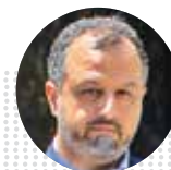
سید احسان خاندوزی وزیر امور اقتصادی و دارایی