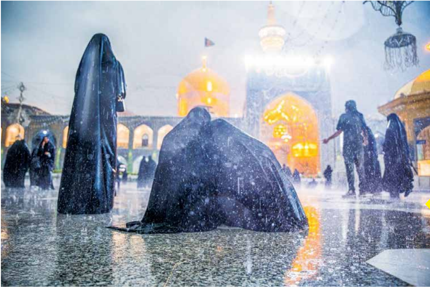
حال و هوای زائران زیر باران شدید دیروز در حرم امام رضا (ع)

در پی بارش شدید باران در مشهد، زائران حرم مطهر امام رضا (ع) در مشهد، زیر سقف الهی ماندند و از نزول رحمت لذت بردند.