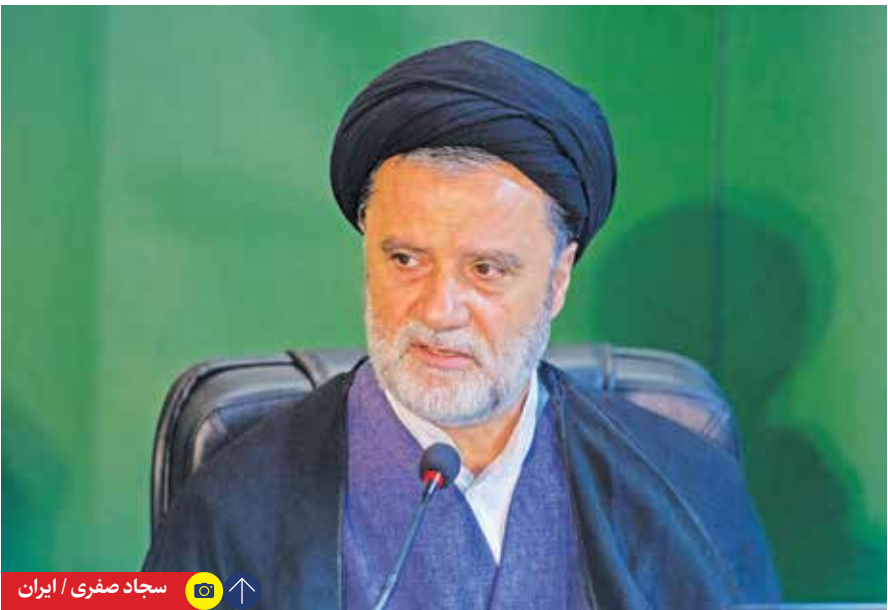
سجاد صفری / ایران

نماینده مردم تهران در مجلس شورای اسلامی، با اشاره به اینکه برخلاف برخی کشورها، آقایان حتی بالاتر از پروتکل الحاقی را پذیرفتند