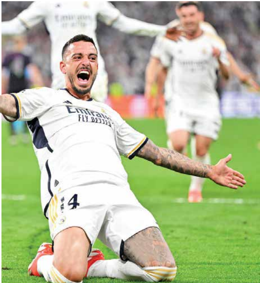
گزارش سید علی بلندنظر خبرنگار