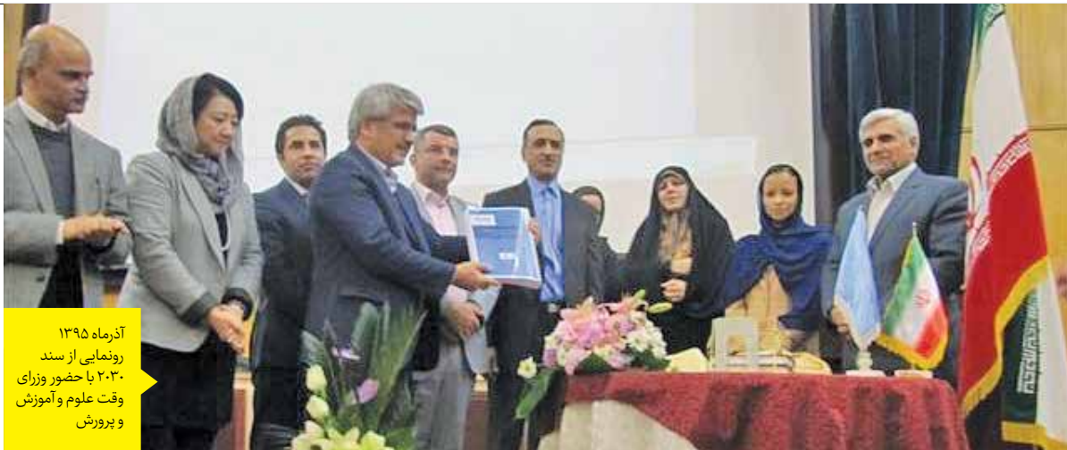
آزمایش ۱۳۹۵ رونمایی از سند ۲۰۳۰ با حضور وزرای وقت علوم و آموزش و پرورش