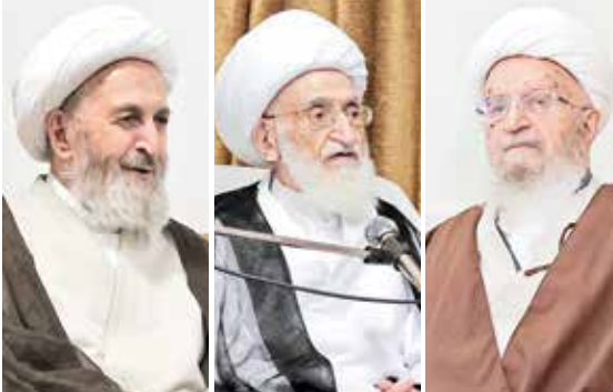
آیت‌الله جوادی آملی، آیت‌الله شبیری زنجانی، آیت‌الله مکارم شیرازی، آیت‌الله نوری همدانی، آیت‌الله سبحانی

چدیدت و تلاش شبانه‌روزی دولت مردمی، امید زیادی برای انجام این کارها ایجاد کرده است، گفت: بنده همواره برای موفقیت جنابعالی و دولت مردمی دعا می‌کنم، پرکاری شخص جنابعالی و ارتباط گسترده شما با مردم، مایه امیدواری دوستداران انقلاب و ناامیدی دشمنان است. رئیس جمهور نیز با بیان اینکه کشور در حال پیشرفت است، تأکید کرد: در عزم دولت برای تسریع و تداوم مسیر رفع مشکلات و توسعه کشور خللی پیش نیامده است.