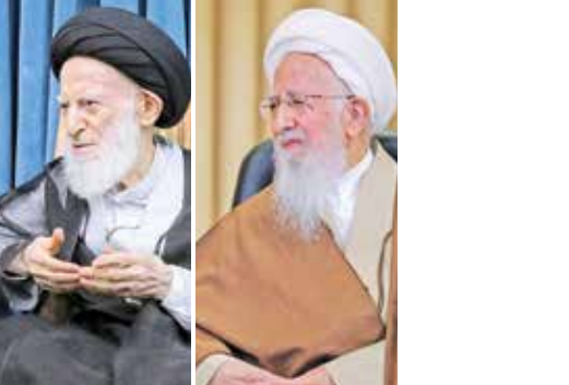
آیت‌الله جوادی آملی، آیت‌الله شبیری زنجانی، آیت‌الله مکارم شیرازی، آیت‌الله نوری همدانی، آیت‌الله سبحانی

چدیدت و تلاش شبانه‌روزی دولت مردمی، امید زیادی برای انجام این کارها ایجاد کرده است، گفت: بنده همواره برای موفقیت جنابعالی و دولت مردمی دعا می‌کنم، پرکاری شخص جنابعالی و ارتباط گسترده شما با مردم، مایه امیدواری دوستداران انقلاب و ناامیدی دشمنان است. رئیس جمهور نیز با بیان اینکه کشور در حال پیشرفت است، تأکید کرد: در عزم دولت برای تسریع و تداوم مسیر رفع مشکلات و توسعه کشور خللی پیش نیامده است.