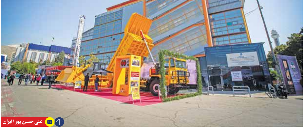
علی حسن پور / ایران

تولید بچه میگوی مورد نیاز در مجتمع پرورش میگوی کمبیشن برداشته است که پیش‌بینی می‌شود در سال جاری بیش از ۱۰۰ میلیون قطعه بچه میگو در این استان تولید شود که با دستیابی به این مهم بخش مهمی از مشکلات مربوط به زنجیره ارزش پرورش میگوی استان مرتفع خواهد شد.