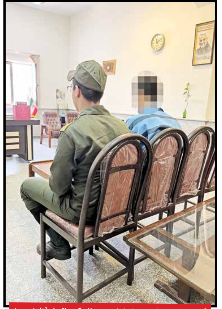
گروه حوادث: مرضیه همایونی / مرد جوانی که به اتهام قتل زن مورد علاقه اش مقابل چشم رهگذران در خیابان دستگیر شده مدعی است فقط می خواسته گوشی تلفن همراه او را واریسی کند.

به گزارش «ایران»، ۲۶ فروردین امسال، صدای درگیری و فریادهای زن و مردی جوان در یکی از خیابان های شمال تهران توجه رهگذران را به خود جلب کرد. رهگذران که شاهد درگیری بودند، ناگهان با صحنه تلخ و عجیبی مواجه شدند.