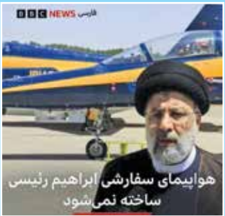
هواپیمای سفارشی ابراهیم رئیسی ساخته نمی شود

«خبر اول اینکه، بی بی سی فارسی در یک کاف رسانه ای مدعی شد، توقف پروژه ای که دهقانی فیروزآبادی معاون رئیس جمهور آن را اعلام کرده، همان پروژه ساخت جت ۷۲ نفره اعلامی از سوی دکتر رئیسی در سال ۱۴۰۱ بوده است.