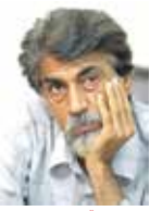
می‌خواستم شعری برای جنگ بگویم دیدم نمی‌شود دیگر قلم‌به‌زبان دلم نیست گفته: باید زمین گذاشت قلم‌ها را دیگر سلاح سرد سخن کارزار نیست