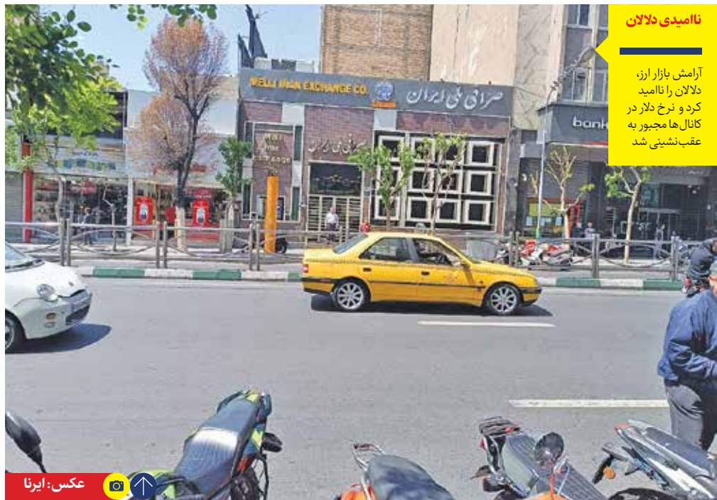
نامیدی دلان آرامش بازار ارز، دلان را ناامید کرد و نرخ دلار در کابل ها مجبور به عقب نشینی شد