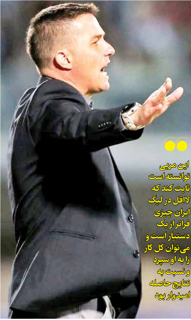
این مربی توانسته است ثابت کند که لااقل در لیگ ایران چیزی فراتر از یک دستیار است و می توان کل کار را به او سپرد و شسپیت به نتایج حاصله امپدوار بود

در نهایت یک مدیریت صحیح و دفاعی کم اشتباه و هنر کنترل توپ و میدان کاری حریفان داشت و بیلبان هایی امتیاز ممکن خارج شوند که در طول مسابقات لیگ بارها محل شکست حریفان بوده است. پرسپولیس جمعه شب مقابل ملوان همین الگوی بازی را تکرار کرد و باز به برتری رسید. اینها به معنای بی عیب و نقص بودن گذشته در مسابقه خانگی آنان با ملوان شکل گرفت. در سیرجان، پرسپولیس بازی را هجومی و خواهنده آغاز کرد و