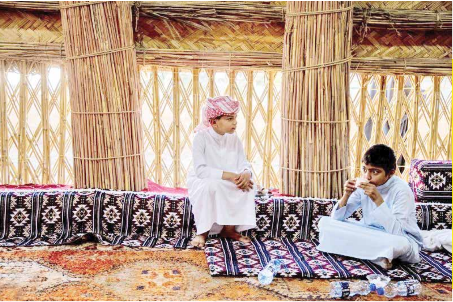
از عرب‌های ساکن استان‌های جنوبی ایران گرفته تا عرب‌های عراق، در مضافات میمهانان خود پذیرایی می‌کنند. سانی بزرگ و گسترده با ستون‌هایی از نی و پوششی از حصیر که شکاف‌هایی پنجره‌مانند برای ورود نور دارد و کف آن با فرش و قالیچه پوشانده می‌شود و مکانی برای پذیرایی از میهمانان و جلسات حل و فصل امور است. ورودی فضیف باید رو به قبله و بدون در بوده تا همواره به روی میهمانان گشوده باشد. ارتفاع این در کوتاه‌است تا افراد وارد شوند به احترام حاضرین در جلسه سر را می‌کنند.