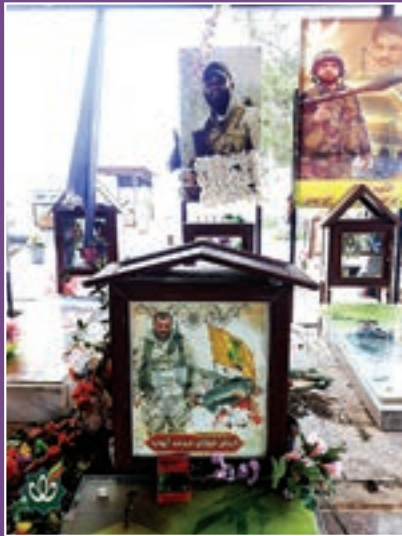
آرامگاه شهید فوزی ایوب در لبنان.

در فرازی از وصیت نامه شهید مدافع حرم حزب الله لبنان، فوزی ایوب آمده است: «لذت جهاد در صفوف مقاومت و پیروزی‌های آن وصف ناپذیر است. تصویری الهی و زیباست. فراتر از لذایذ دنیوی است. این عشق و محبت را خود خداوند به مجاهد در راه خود عنایت می‌کند...»