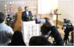
وزیر فرهنگ و ارشاد اسلامی: