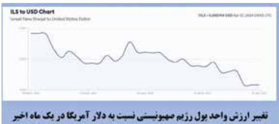
تغییر ارزش واحد پول رژیم صهیونیستی نسبت به دلار آمریکا در یک ماه اخیر

جاری در غزه بر اقتصاد اسرائیل بوده است. «امیر یارون»، رئیس بانک مرکزی اسرائیل اخیراً اعلام کرد که هزینه‌های این رژیم در نتیجه جنگ بین سال‌های ۲۰۲۳ تا ۲۰۲۵ به حدود ۲۰ میلیارد شکل یا ۵۸ میلیارد و ۳۰۰ میلیون دلار می‌رسد که به این مبلغ باید از بین رفتن درآمد‌ها به دلیل آثار جنگ را نیز در قالب موضوعات و عناوین متعدد تحلیل کرد.