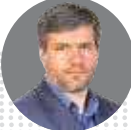
مصطفی زمانیان رئیس مرکز بررسی‌های استراتژیک ریاست جمهوری