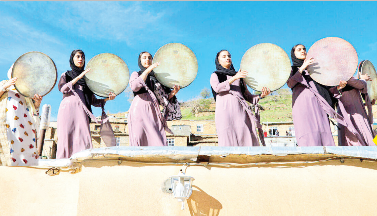
مراسم آیینی مذهبی هزار دف عصر پنج‌شنبه (۱۶) فروردین (۱۴۰۳) با حضور جمعی از مداحان و گروه هزار دف در روستای دگاک استان کردستان برگزار شد.