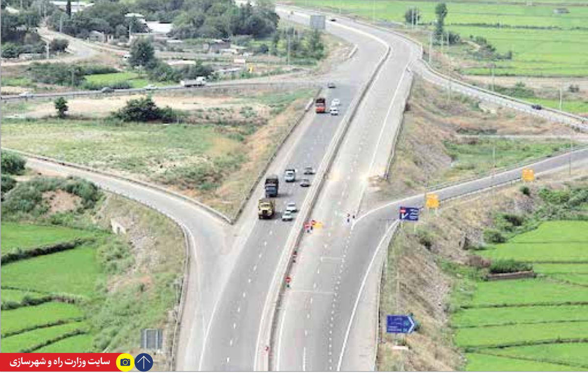
یک نمای هوایی از آزادراه قزوین-رشت در حال تکمیل