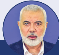
اسماعیل هنیه: طوفان الاقصی فلسطین رادر قلب میلیون ها آزاده زنده کرد