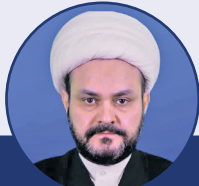
شیخ اکرم الکعبی: مقاومت اسلامی عراق حامی ملت فلسطین است