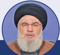
سید حسن نصرالله : طوفان الاقصی رژیم صهیونیستی را به لرزه درآورد