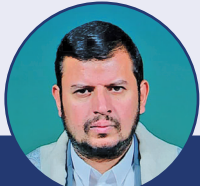
بدرالدین الحوثی: امریکا شریک واقعی صهیونیست‌هاست