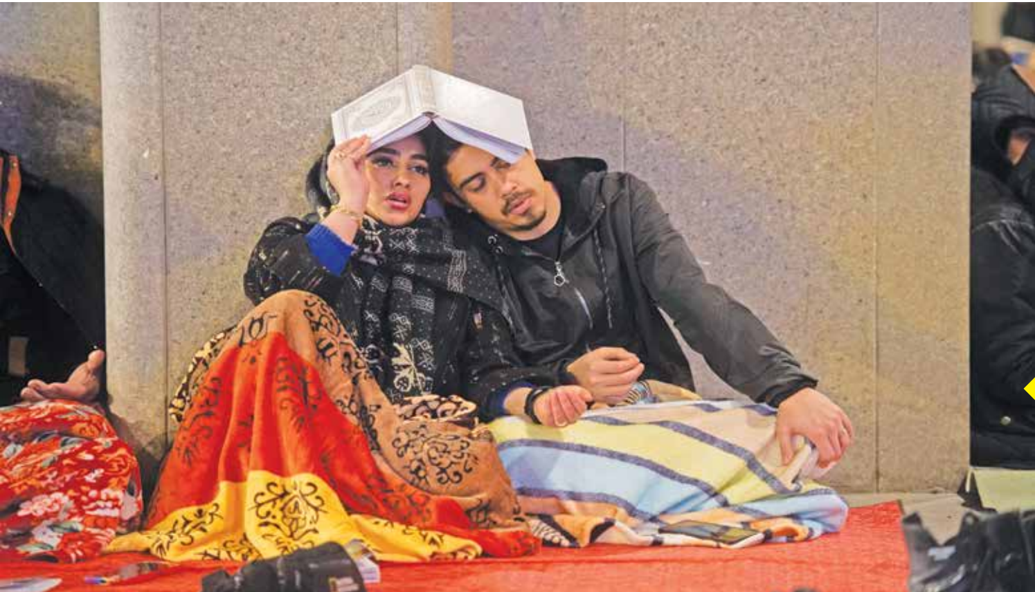
مراسم احیای شب بیست و سوم رمضان در مصلای تهران