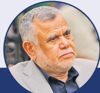
هادی العامری: مقاومت، رژیم اشغالگر را به سوی سرازمی شکست سوق داد