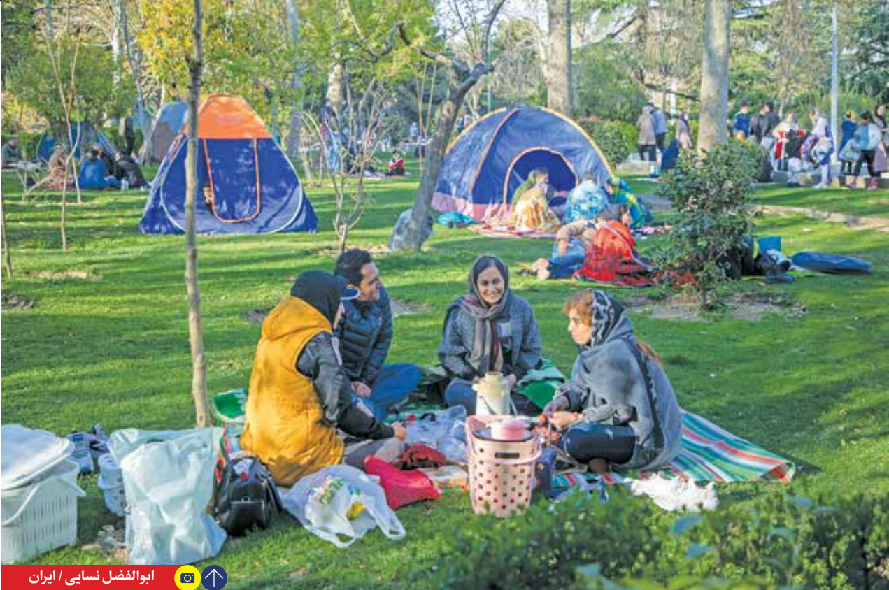
ابوالفضل نسایی / ایران