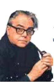
بزرگی کشورها را با ساحت و تعداد جمعیت‌شان نمی‌سنجند. بزرگی کشورها از عظمت اندیشه‌ان ناشی می‌شود. ماکس فریش (رمان‌اشتراخ صفحه ۹۲)