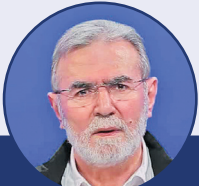
زیاد النخاله: باید وحدت ملت ها و اهداف را تقویت کنیم

به گزارش خبرگزاری مهر به نقل از العهد، دبیر کل حزب الله لبنان در سخنانی در مراسم منبر القدس گفت: «اچه در فلسطین و مستعمرات و جهان غرب می دهد طوفان آزادگان است و امیدواریم که بزرگ و مستقیم شود و به هر طرف اوج شود. سواران راه مقاومت در غزه را حج می نهیم. مبارزانی را که مقاومت در کرانه باختری و تداوم نبرد شد افتخارگران را ارج می نهیم.» دبیرسخت صرصرانی، دبیر کل حزب الله لبنان همچنین با اشاره به روز قدس گفت: «روز قدس اسمال بسیار متفاوت از سالهای گذشته است و این به برکت طوفان الاقصی است. ما پیاداری مقاومت در غزه و ملت فلسطین را در برابر ارتش اشغالگری را می ستاییم و ملت فلسطین حسمهای در بزم رقم زدند. وظیفه ما روز قدس تبیین نتایج راهبردی است که طوفان الاقصی محقق کرده است بویژه خسارات راهبردی پروژه ارتش و اسرائیل در منطقه»