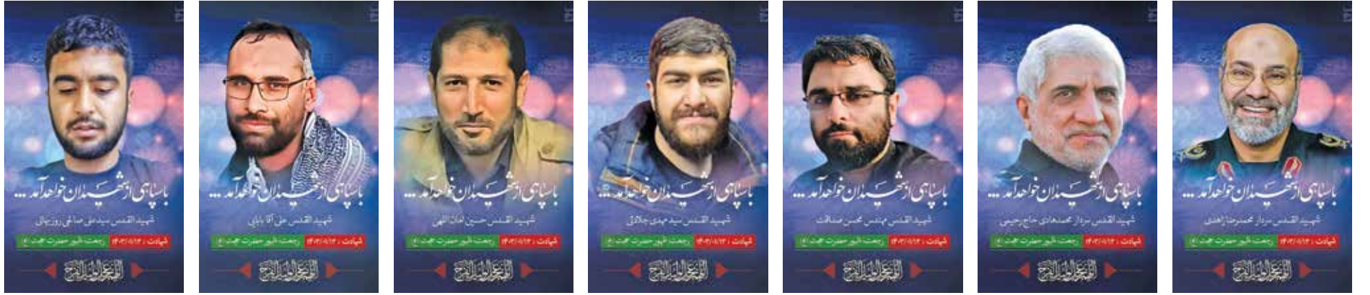
تصاویر شهدای حادثه تروریستی دمشق

به گزارش خبرگزاری صدا و سیما، خواجه آصف افزود: اگر امریکا حرف از تحریم می‌زند باید جایگزین این طرح مقرون به صرفه را نیز به ما بگوید.