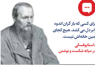
برای کسی که بارگزار اندوه زار بدل می کشد، هیچ کجای زمین خانه اش نیست. داستانیوفسفی در میانه شکست و نوشتن