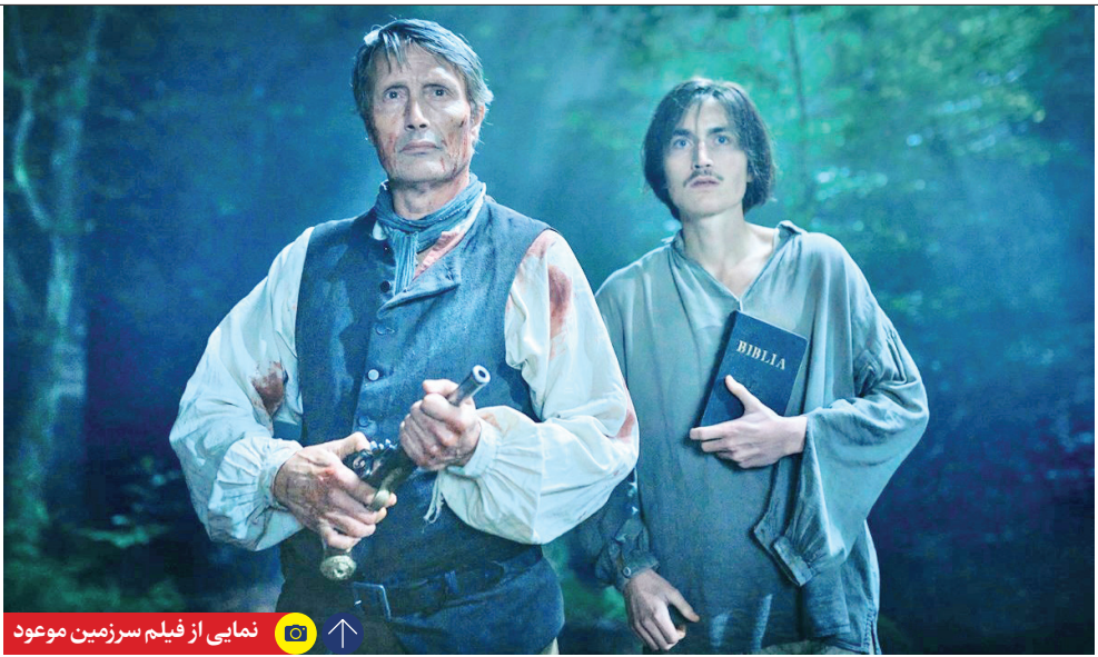
نمایی از فیلم سرزمین موعود