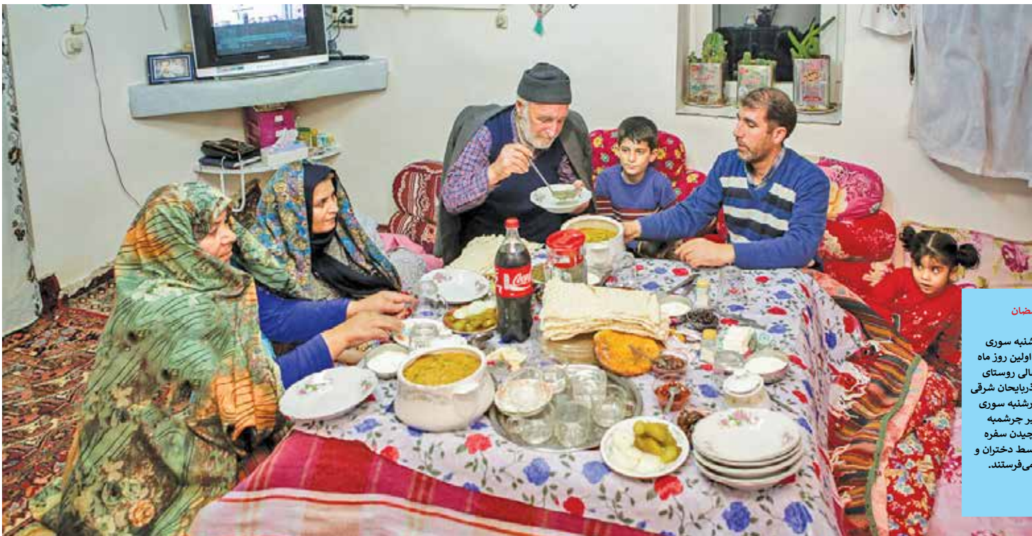
چهارشنبه سوری و رمضان در گول اخیر همزمان با شب چهارشنبه سوری که امسال مصادف با اولین روز ماه مبارک رمضان بود، اهالی روستای گول اخیر، در استان آذربایجان شرقی به مناسبت شب چهارشنبه سوری غلایی به عنوان «آخر چرشمه بایی» آماده و پس از چیدن سفره روی کرسی، غذا را توسط دختران و پسران به خانه اقوام می فرستند.