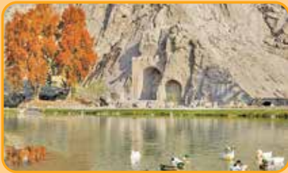
طاق بستان در کرمانشاه

می شوند. این کارشناس برای جلوگیری از ترافیک یادآور می شود که روستاها در این منطقه شبیه به هم هستند و اگر مسیر پرترافیک بود می توانند نزدیک روستاهای معروف و شلوغ آن مثل اورامان تخت و پالنگان در کردستان یا روستای هیچ در کرمانشاه شوند. فاطمی تأکید می کند که در مسیرهای کوهستانی آب و هوا چک شود و مسافران هم با تجهیزات لازم به این روستاها سفر کنند.