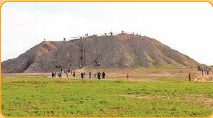
تپه ۵۰۰۰ ساله کنارسندل در جیرفت

وزارت میراث فرهنگی، گردشگری و صنایع دستی هر سال محورهای مختلف را برای سفرهای نوروزی معرفی کند. محورهای کمتر شناخته شده ای که بار ترافیکی را هم از