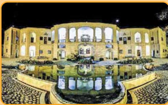
باغ جهانی اکبریہ در بیرجند

فرقی ندارد از طیس به بیرجند بروی یا از بیرجند به طیس. این مسیری است که به گفته فاطمی می تواند تو را میهمان جاذبه های روستایی متعددی کند. به دره کال جنی بروی، سد کریت را ببینی. میهمان اهالی روستاهای نایبند، اصفهک و... بشوی. به گفته او در تک تک این روستاها می توانی خانه های بومگردی پیدا کنی. روستای اصفهک ۹ مرکز بومگردی دارد. روستای کریت و ازمیغان در جاده طیس هم بومگردی دارد. به گفته فاطمی اکثر روستاهای خراسان جنوبی هم دارای بومگردی های متعدد هستند. او می گوید: «در بیرجند هم می توانی در هتل اقامت کنی، باغ اکبریہ بیرجند یکی از باغ های ثبت جهانی شده در یونسکو را به تماشا بنشینی و تاریخ قاجاریه اش را ورق بزنی.»