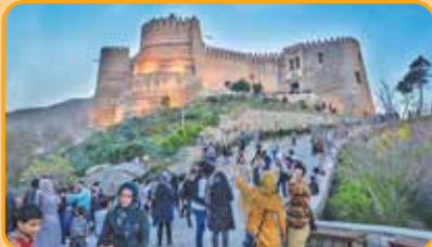
فلک الافلاک در خرم آباد

مسافر این مسیر باستانی می کنند.» او همزیستی اقوام مختلف ایران چون کردها، لک ها، فارس ها، لرها، ترک ها و عرب ها را از دیگر جاذبه های گردشگری می داند که سفر را به مقصد غرب کشور دلپذیر می کند.