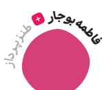
فاطمه بوجاری طنزپرداز

یاد تونه...؟ فروردین ماه امسال بود که خبر اختلاس زلنسکی از کمک‌های آمریکا منتشر شد. مردم جنگ‌زده اوکراین اولش امیدوار بودند که با توجه به کم‌دین بودن زلنسکی این خبر دروغ آوریلی، بخشی از یک استندآپ کمدی جدیدی چیزی باشد که متأسفانه دیدند اوضاع خیلی خسته!