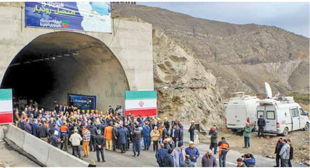
بهره‌برداری از آزادراه منجیل - رودبار

سلامت قرار گرفتند، معنایی جز گام بزرگ دولت در تحقق عدالت در حوزه سلامت، درمان و بهداشت ندارد. سازمان بیمه سلامت نیمی از جمعیت کشور را تحت پوشش بیمه‌ای خود دارد و افرادی که تحت پوشش هستند عمدتاً در چهار گروه قرار می‌گیرند که شامل کارکنان دولت و خانواده‌های آنان، روستاییان و عشایر، ساکنان شهرهای با جمعیت کمتر از ۲۰ هزار نفر، خانواده‌های شهدا و ایثارگران و مددجویان بهزیستی و کمیته امداد و طلاب مشغول به تحصیل در حوزه‌های علمیه و دانشجویان هستند. همچنین پنج دهک اول جامعه به‌صورت رایگان بیمه شده سازمان بیمه سلامت هستند و طبق اطلاعات موجود، دهک‌ها به‌صورت خودکار بیمه شدند.