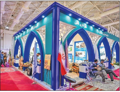
مروری بر هفدهمین دوره نمایشگاه گردشگری تهران در سالی که رو به پایان است