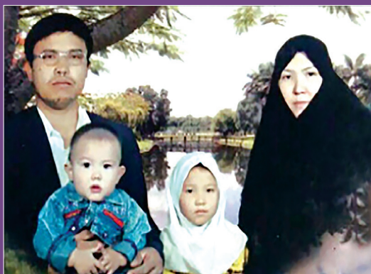
تصویر دوران جوانی شهید توسلی در کنار دو فرزند و همسرشان