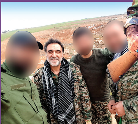
منطقه عملیاتی تدمر

فعالیت‌های جهادی و فرهنگی بازگشت. از سال ۱۳۶۱ شهید وارد فعالیت‌های جهادی و مبارزاتی در قالب تشکیلات شد و در زاهدان، نایباد و بیرجند در راستای کمک به مهاجرین فعال بود.