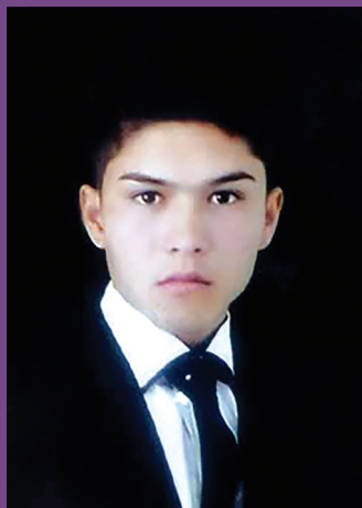
آخرین تصویر شهید پیش از عزیمت به سوریه و شهادت