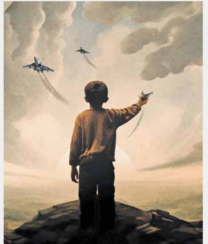
لینا جرادات / طراح