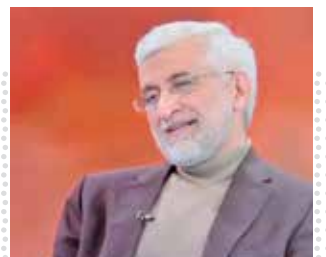
جام جم آنلاین

جلسه هیأت وزیران عصر دپوروز (یکشنبه) به ریاست معاون اول رئیس جمهور برگزار شد. محمد مخبر در این جلسه با قدرانی از مردم عزیز، ولایتمدار و آگاه کشور برای حضور در انتخابات گفت: به رغم برنامه ریزی ها و تخریب هایی که از ماه های گذشته و با هزینه های سنگین در خارج از کشور برنامه ریزی شد تا کسی در انتخابات شرکت نکند، اما مردم کشور مانند همیشه پای نظام ایستادند و به فرمانباش مقام معظم رهبری عمل کردند. وی همچنین با تأکید بر ضرورت تسریع در عملیات امدادرسانی به سیلزندگان سیستان و بلوچستان گفت: وزیر کشور با دستور رئیس جمهور برای مدیریت شرایط در استان هستند و تمام دستگاه های اجرایی موظفند بر اساس درخواست آقای وحیدی همه امکانات مورد نیاز را برای حل مشکلات مردم نذارک بینند. معاون اول رئیس جمهور همچنین پرتاب ماهواره «پارس ۱» را از اختراعات این دولت پرشمرد و با اشاره به اقدامات انجام شده و برنامه ریزی های صورت گرفته اظهار امیدواری کرد، شاهد دستاوردهای بزرگ تر در این زمینه باشیم.