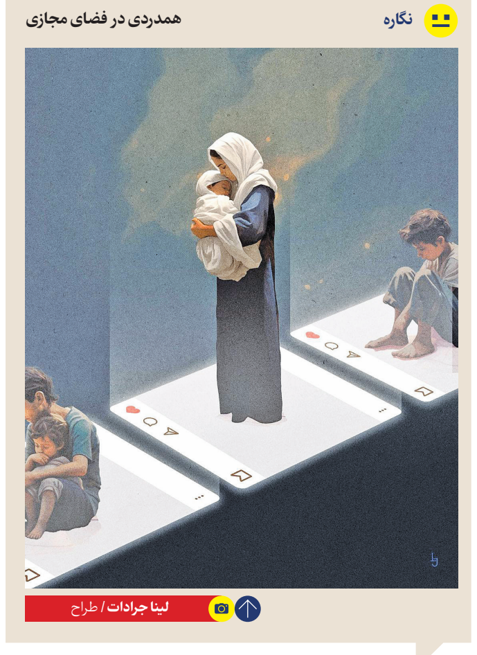
لینا جرادات / طراح