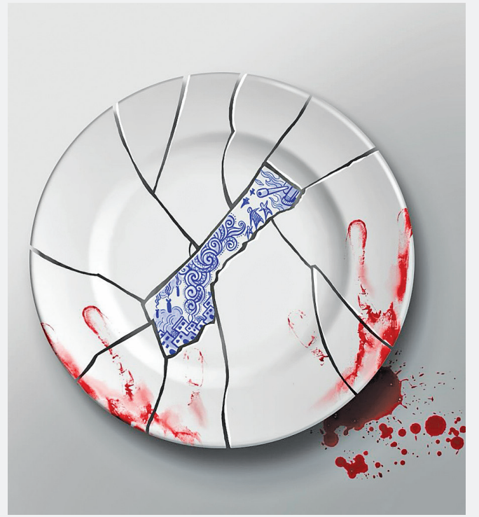
اسامه حجاج / طراح