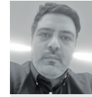
محمد تقی زاده روزنامه‌نگار