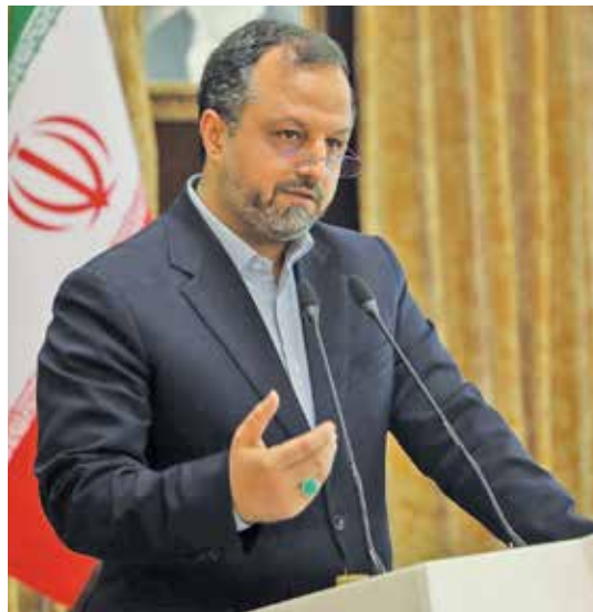
است. در حوزه سرمایه گذاری خارجی هم خوشبختانه از ابتدای شروع به کار دولت سیزدهم تا ابتدای اسفند ماه بیش از ۱۱ میلیارد

اقدام دولت برای تأمین امنیت غذایی خانوارها برش خاندوزی با اشاره به سه اقدام عملی دولت در حوزه تأمین امنیت غذایی خانوارهای ایران در آستانه سال نو و ماه مبارک رمضان، گفت: طرح فخرانه کالبرگ یکی از این اقدامات بوده است که با استقبال خوبی نیز مواجه شد؛ بیش از ۱۴ میلیون خانوار که شامل ۲۲ میلیون نفر می شود از طرح کالبرگ فخرانه استفاده کردند و در این مدت ۳۸ هزار میلیارد تومان از طریق فروشگاه های مدنظر و اقلام موردنظر خرید شده است. سخنگوی اقتصادی دولت از طرح ملی پسته به عنوان دومین اقدام دولت نام برد و افزود: در این طرح که با همکاری وزارت کار، تعاون و رفاه اجتماعی انجام می شود، برای مادران دارای کودک زیر ۳ سال ۴۰۰ هزار تومان پارهانه اختصاص یافته است. به گفته خاندوزی، سومین اقدام طرح امنیت غذایی کودکان زیر ۳ سال دهک های یک تا ۵ یک میلیون تومان و برای دهک های ۵ تا ۸ هفت تیر ۶۰۰ هزار تومان اختصاص یافته است. وی تأکید کرد: همه تلاش ما این است که آغاز سال نو با وفور کالاهای مورد نیاز و قیمت های مناسب و در دسترس مردم باشد و امیدواریم که طبق برنامه ریزی های انجام شده برای تأمین و کنترل قیمت های مورد نظر پیش برویم.