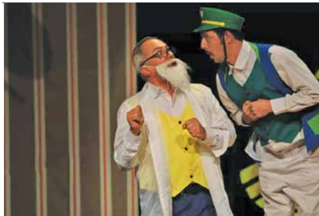
عکس تزئینی است

مسابقه نوجوان بیست و هشتمین جشنواره بین‌المللی تئاتر کودک و نوجوان شرکت داشته، درباره اهمیت برپایی چنین رویدادهایی، به خصوص وقتی بحث مخاطبان کم سن و سال در میان باشد به «ایران» گفت: «در هر تعبیر و تعریفی که تا به امروز برای تئاتر کودک و نوجوان ارائه شده، مهم‌ترین نقش را برای آموزش مهارت‌های زندگی به کودکان و نوجوانان و فرهنگ‌سازی جامعه قائل شده‌اند.» وی با تأکید بر اینکه کارکرد آموزشی تئاتر قابل چشم‌پوشی نیست ادامه داد: «تئاتر می‌تواند از طریق شکفتن و هیجان‌بازی و شادمانی، مخاطبان را به سوی حقیقت رهنمون سازد و ما را از آنچه در پیرامون‌مان قرار گرفته