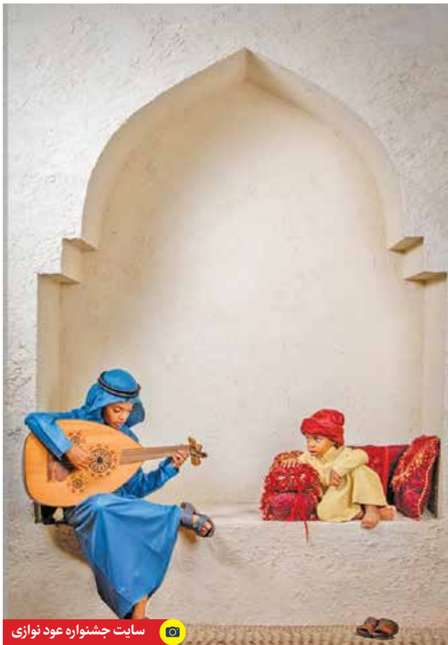
سایت جشنواره عود نوازی

الهه کیان‌فرد، نویسنده و کارگردان تئاتر که با نمایش «علاء الدین» در بخش