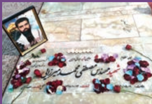
یادبود در شبستان امام خمینی ره واقع در حرم حضرت شاه عبدالعظیم ع