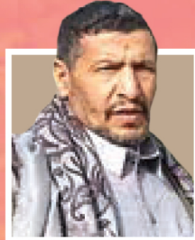
علامه عبدالله عیضا الرزامی