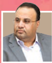
صالح علی الصماد