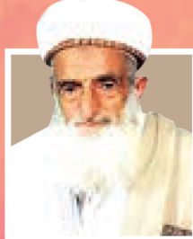
علامه بدرالدین حوثی