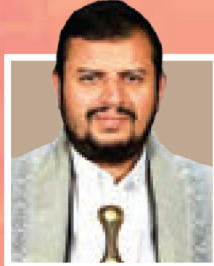
سید عبدالملک الحوثی